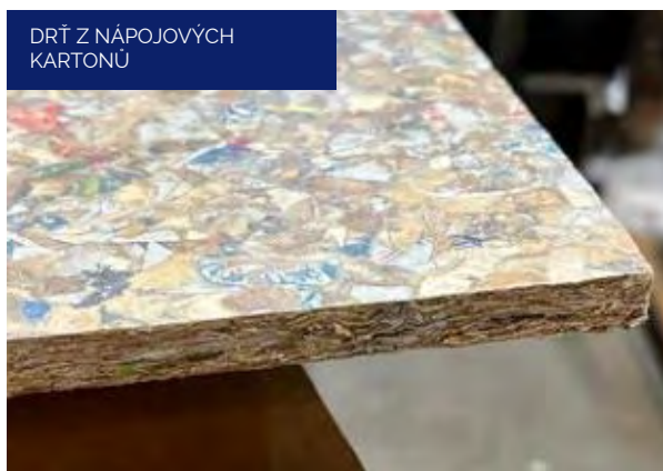
DRŤ Z NÁPOJOVÝCH KARTONŮ

Originální vzhled nabízí modifikace PackWall Design (viz foto) s průhlednou krycí vrstvou a přiznanou strukturou původního materiálu. Desky PackWall tak v udržitelném stavebnictví najdeme kupříkladu jako plnohodnotné alternativy dřevovláknitých a sádkartonových elementů suché výstavby domu.