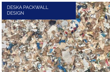
DESKA PACKWALL DESIGN

Na začátku celého procesu je oddělený sběr nápojových kartonů s co nejnižším obsahem věcí, které se do oranžových kontejnerů na tříděný odpad dostaly omylem – sklo, dřevo, kov apod. Následně jsou kartony od nápojů rozdrčeny, sušeny, za vysokých teplot a lisovány do desek a řezány na příslušné formáty. Desky jsou v podstatě kompozit, složený z celulózy, polyetylenu a hliníku (všechno součásti potravinářských kartonů), uzavřený mezi dvěma papírovými plochami.